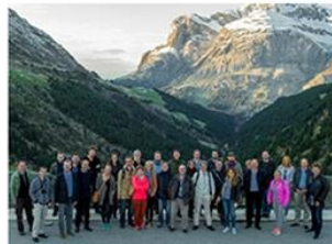
ABB - 125 godina uspešnog poslovanja